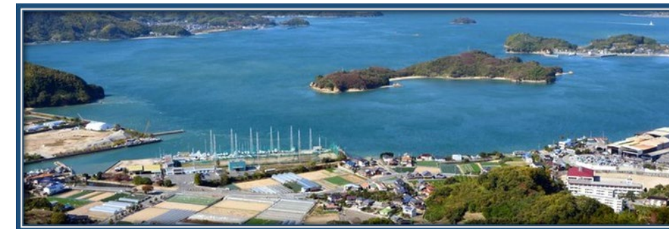
しま山100選「白滝山」より撮影