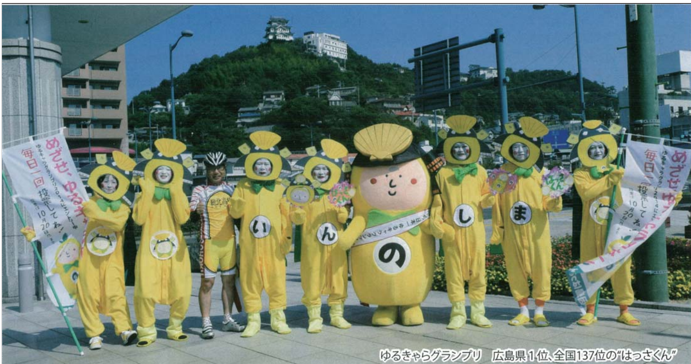
ゆるきゃらグランプリ 広島県1位、全国137位の「はっさくん」