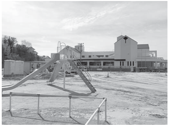
写真:2月21日時点の工事状況

開校式・始業式が4月6、7日入学式がおこなわれ、児童数は男子213人、女子189人、合計402人(学級数15)でスタートします。