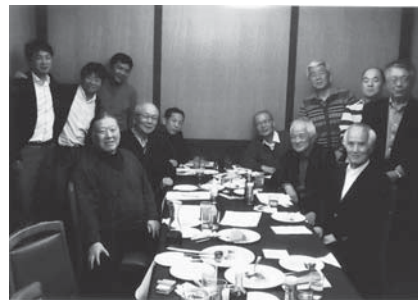
2015年東京支部新年会&幹事会、最高顧問、顧問を囲んで丸の内ポールスターで支部活動の確認と来年の総会準備をスタート

次回の東京支部総会は、来年2016年夏を予定しており、皆様の参加をお待ちしています。