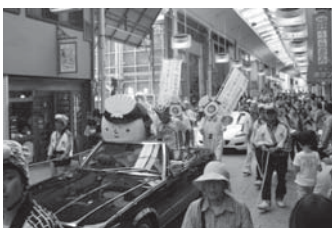
(尾道市の全国仮装大会inおのみちに)